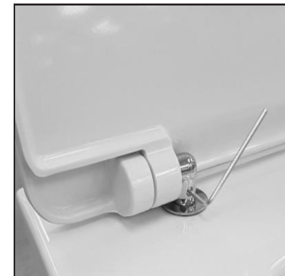
09 Stringere con la chiave in dotazione (brucola) la cerniera sul pin di fissaggio. Tighten the hinge on the screw's pin by using the provided key.