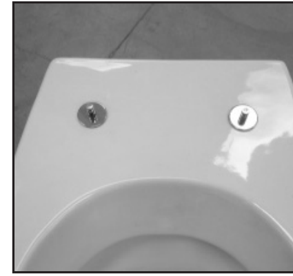
04 Fissaggi inseriti. Inserted fixing screws.