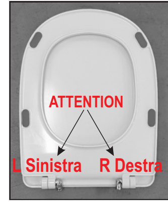
05 Inserire le cerniere negli appositi fori. Insert the hinges in the appropriate openings.