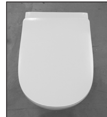
10 Copriwater installato. Installed seat cover.