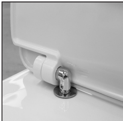
06 Alloggiare il Cw negli appositi fissaggi senza bloccare. Insert the seat cover in the appropriate fixings do not block.