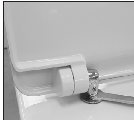
08 Stringere con la chiave in dotazione il fissaggio. Tighten the fixing screw by using the provided key.