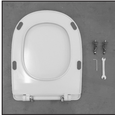
01 Composizione. Composition.