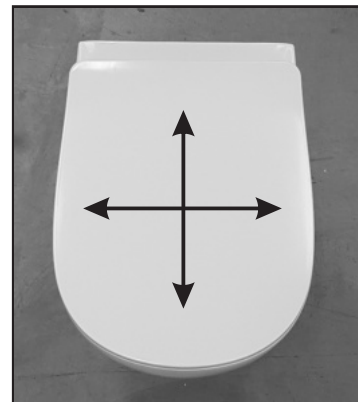
07 Verificare il corretto posizionamento del copriwater prima di serrare definitivamente il fissaggio. Before tightening the fixing screw check the correct position of the seat cover.